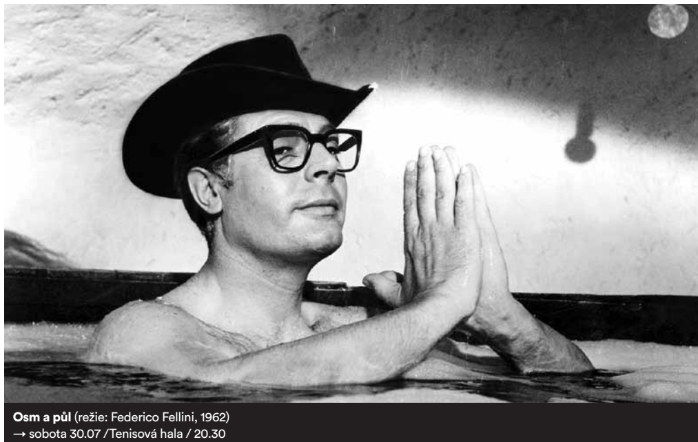
Osm a půl (režie: Federico Fellini, 1962) → sobota 30.07 / Tenisová hala / 20.30

Cesta do fantazie je jedním z nejslavnějších děl anime. V rámci tohoto směru pak existuje celá řada zajímavých odnoží. Možná jste zaznamenali, že teď frčí ve fanouškovských komunitách párování hlavních mužských hrdinů z nejrůznějších seriálů. Benedict Cumberbatch a Martin Freeman o tom ví díky Sherlockovi své. Japonské anime má ale pro tuto homosexuální lásku přímo legitimní žánr