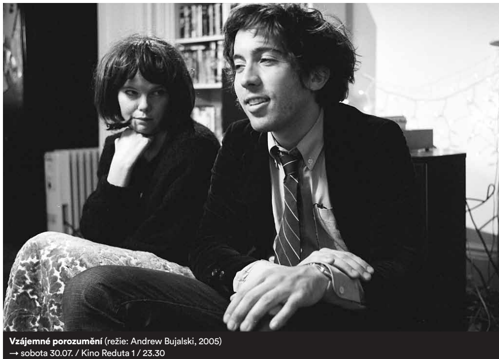
Vzájemné porozumění (režie: Andrew Bujalski, 2005) → sobota 30.07. / Kino Reduta 1 / 23.30

Název mumblecore („mumble“ je česky mumlat) je odvozen od nezřetelné mluvy, která všechny snímky spojuje. Termín se poprvé objevil v rozhovoru pro server IndieWire