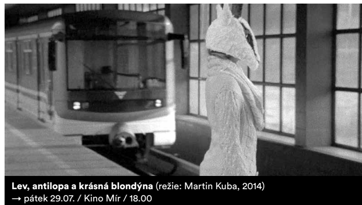
Lev, antilopa a krásná blondýna (režie: Martin Kuba, 2014) → pátek 29.07. / Kino Mír / 18.00

Kromě světových velikanů se LFŠ zaměřuje také na studenty a jejich tvorbu vznikající v líných filmových škol. Od Písku po Bratislavu. Letos představuje hned šestici autorů, kteří se nebojí alzheimeru ani lva lovícího antilopu v pražském metru. Podívejme se na ty, jejichž tvorbu můžete ještě do konce Filmovky stihnout vidět.