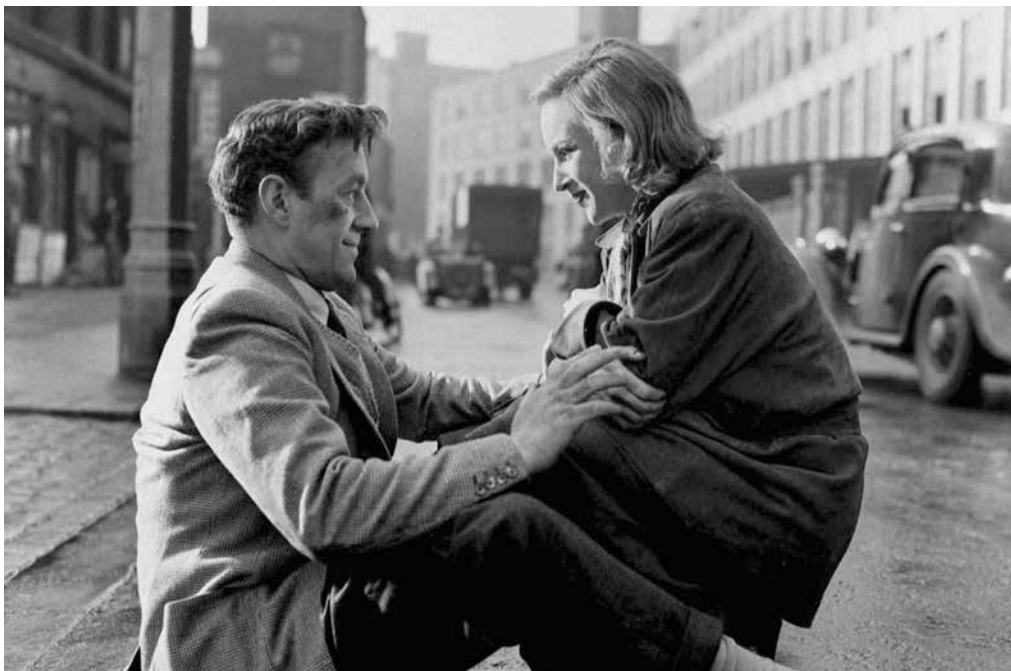
Muž v bílém obleku (režie: Alexander Mackendrick, 1951) → středa 27.07. / Tenisová hala / 11.00

Historie filmování na západolondýnském předměstí Ealing se začala psát už kolem roku 1902. Zvukové filmové studio pak na místě postavil v roce 1931 Basil Dean, který ho využil hlavně pro natáčení sentimentálních hudebních komedií s populárními hvězdami varieté. Skutečné dějiny značky Ealing Studios ale začínají až v roce 1938 příchodem Michaela Balcona, v té době již zkušeného producenta zastávajícího názor, že by Británie místo nápodoby Ameriky