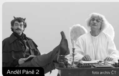
Anděl Páně 2

Jako RWE jsme byli hrdí, že můžeme být součástí Vašich životů. Chceme být dobře připraveni na budoucnost, a proto jdeme o krok dále. Měníme se z RWE na innogy.